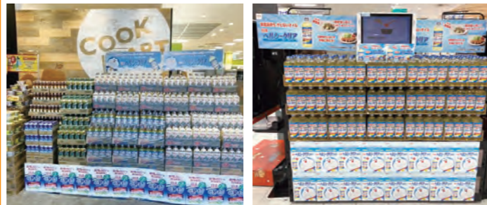
クックマート 浜名湖西店様