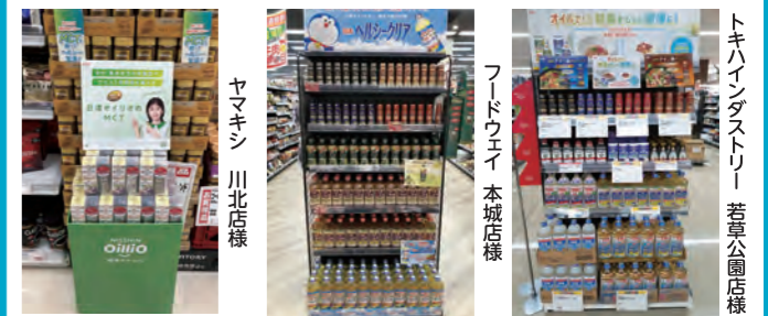
ヤマキシ 川北店様