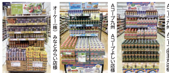
オケイ(株) みなとみらい店様