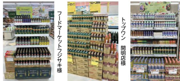
フードマーケット フジサキ様