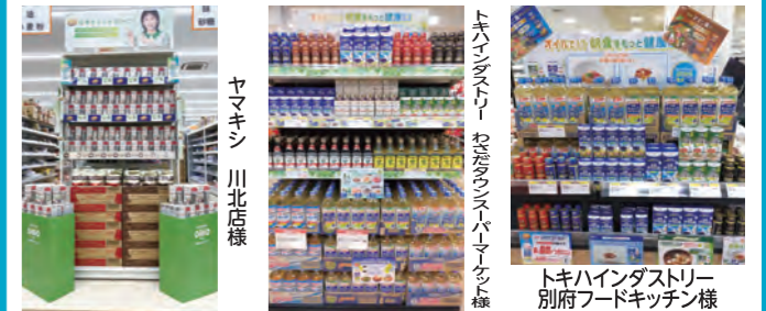
ヤマキシ 川北店様