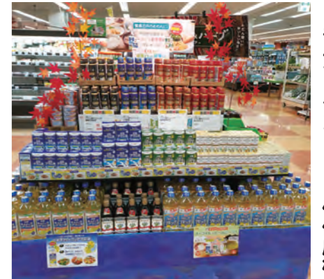
トキハインダストリー 佐伯店様