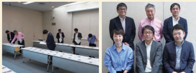
ディスプレイコンテスト 審査風景&審査員