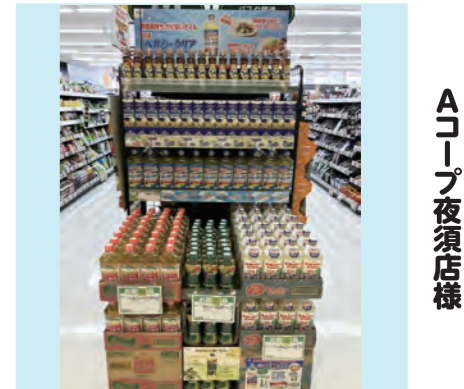
A コープ九州 JAFファーマーズ A コープ夜須店様