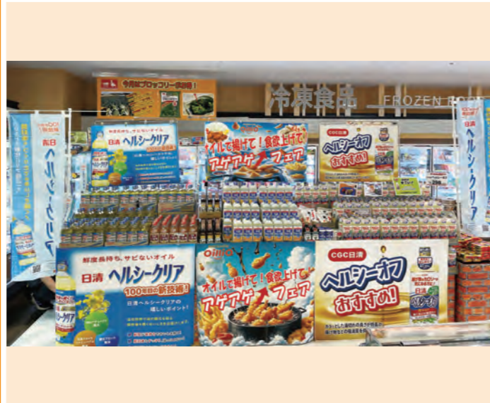
ホクノー 中央店様