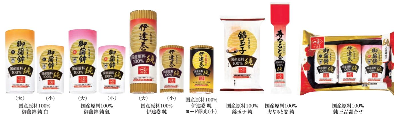
(大) 国産原料100% 御蒲鉾純白 (小) 国産原料100% 御蒲鉾純紅 (大) 国産原料100% 伊達巻純 (小) 国産原料100% 伊達巻純 ヨード卵光(小) 国産原料100% 錦玉子純 国産原料100% 寿なると巻純 国産原料100% 純三品詰合せ