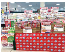
株セブンスター 石井店様