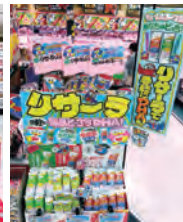
株長崎屋 ドン・キョーテ 二俣川店様