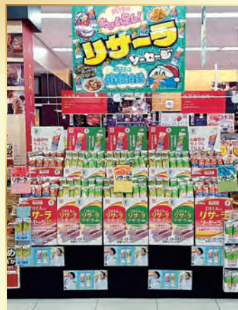
UDリテール(株) MEGAドン・キョーテ 佐原東店様(茨城県)