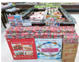
株サンリブ マルショク 天籟寺店様