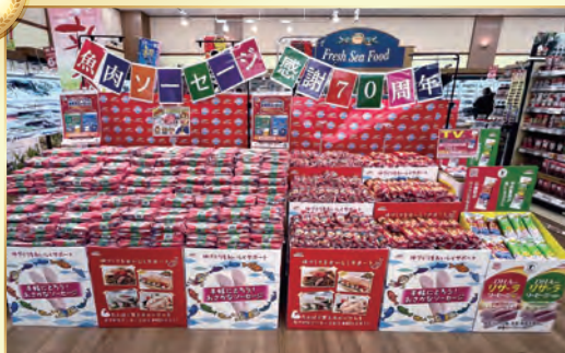
(株)マルイチ 財光寺店様(宮崎県)