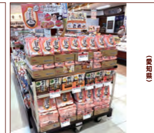
株式会社フィールコーポレーション 富田店様 (愛知県)