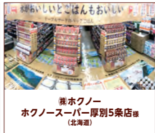
株式会社ホクノール 厚別5条店様 (北海道)