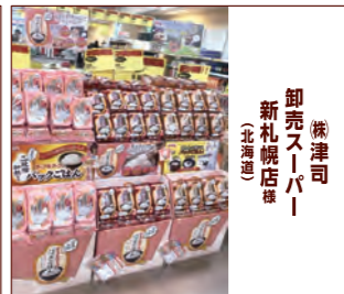
卸売スーパー 新札幌店様 (北海道)