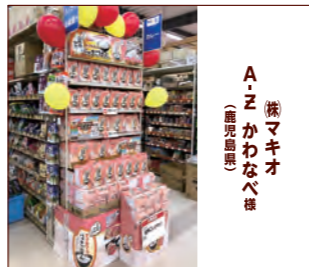
A-Z かわなべ様 (鹿児島県)