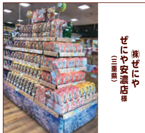
せごや安瀬店様 (山梨県)