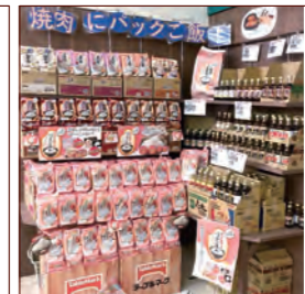
株式会社丸コマルコストアー 食品スーパーマルコ 東苗穂店様 (北海道)