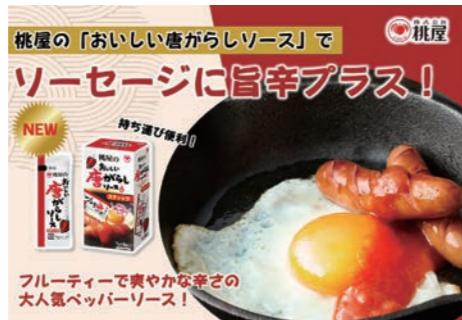
●おいしい唐がらしソーススティックレシピPOP