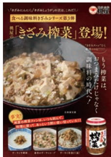
●きざみ榨菜レシピ紹介パンフレット