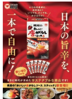
●おいしい唐がらしソーススティックレシピ紹介パンフレット