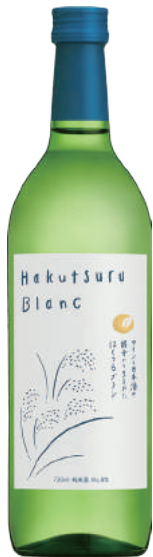
Hakutsuru Blanc 720ml