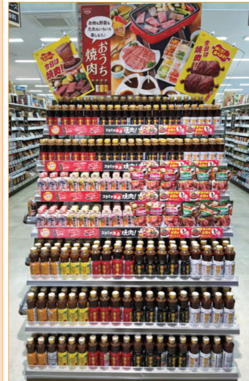
新習志野店様（千葉県）