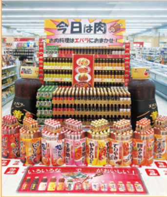
いくわ店様 （三重県）