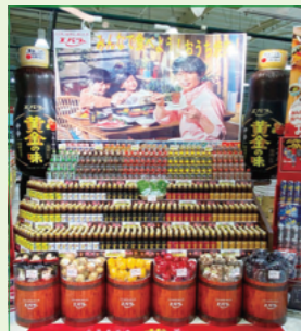
株式会社ウジエスーパー 飯野川店様 (宮城県)