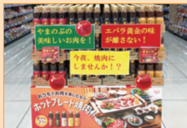
野見山店様（愛知県）