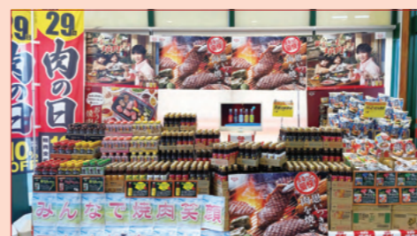
株式会社タカラ・エムシー フードマーケットマム高松店様（静岡県）