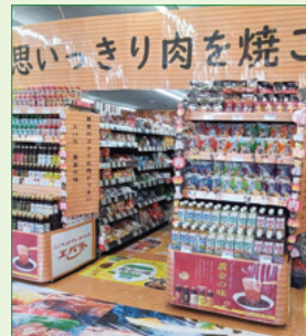
株式会社ホクノ ちびホク厚別 5 条店様 (北海道)