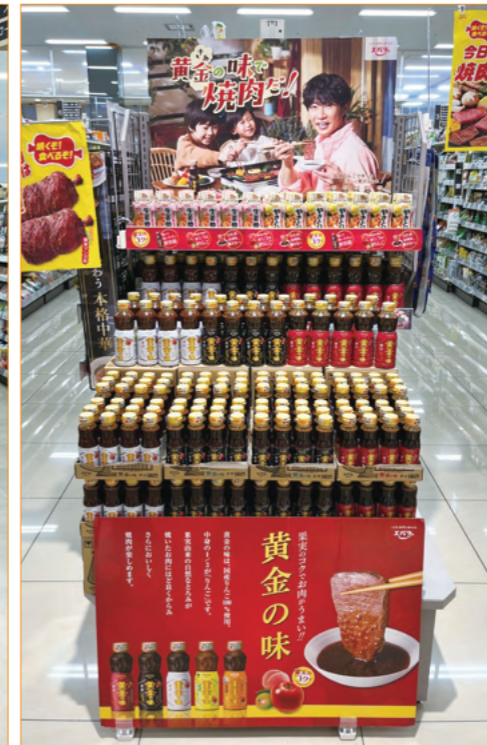
五香元山店様（千葉県）

4月29日の「肉の日」とゴールデンウィークという焼肉需要が高まるこの時期に実施されるディスプレイコンテストであることから、毎回、全店で参加。エンドでの売場づくりを各店が工夫を凝らして実施しています。エンドでボリューム感を出し、視認効果を高める演出として、前方への張り出し陳列をはじめ、トップボードやのぼりなどの POP を活用することで、高さや動きが生まれるため、離れた位置からも目立つ売場になる演出が行われています。