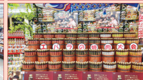
株式会社 A コープ西日本 A コープエルシー店様（島根県）