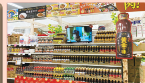
株式会社スーパーバリウム スーパーバリウム上尾愛宕店様（埼玉県）