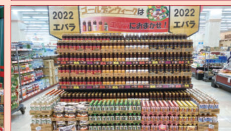
株式会社フィールコーポレーション 美浜店様（愛知県）