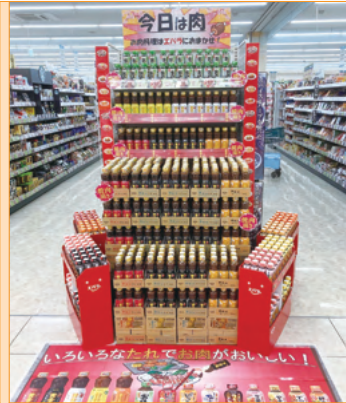
こもの繁盛店様 （三重県）