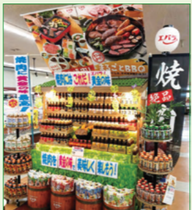
株式会社たけよし スーパーたけよし様 (奈良県)