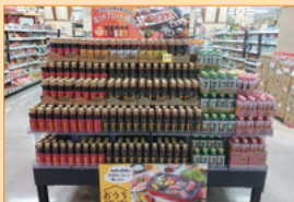
元寺店様（和歌山県）