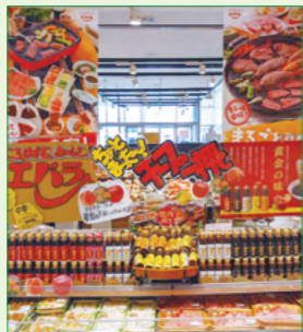
株式会社ウジエスーパー 小野田店様 (宮城県)