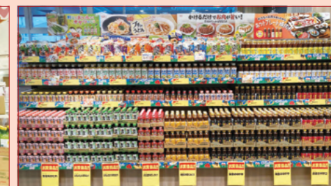
株式会社デライト クックマート可美店様（静岡県）