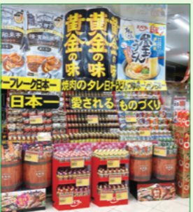
有限会社ケーワイカンパニー キッチンランド SUNSUN 様 (京都府)