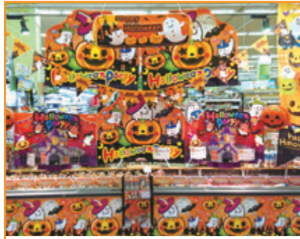
(株)エコス TAIRAYA 中神店様 (東京都)