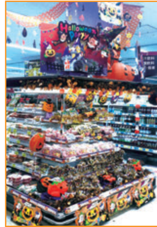
相鉄ローゼン(株) モザイク港北店様 (神奈川県)