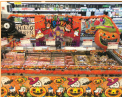
生活協同組合おかやまコープ コープ北畝店様 (岡山県)