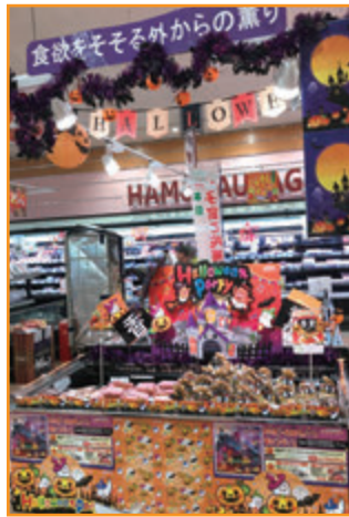
音見屋グループ (株)新鮮館おくえつ ハニー新鮮館こぶし通り店様 (福井県)