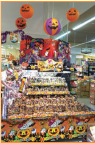
(株)松源 パレード泉佐野店様 (大阪府)