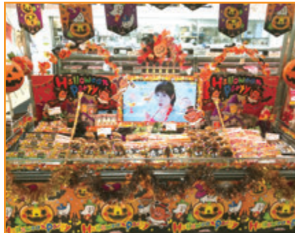
(株)フジ フジグラン山口店様 (山口県)